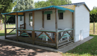
Mobil'home 3 ou 6 places

Le camping vous propose des emplacements ombragés avec possibilité de louer des mobil-homes 3 ou 6 places.